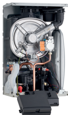
Puma Condens 18/24 MKV-AS/1